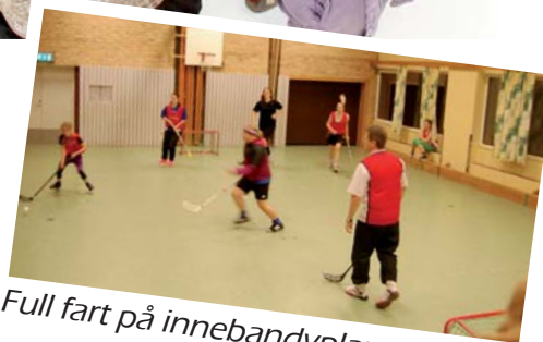
Full fart på innebandyplanen!