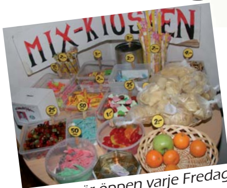
Mix-kiosken är öppen varje Fredagkväll!

Allt du behöver veta och lite till finns på: www.Fredagsmix.se